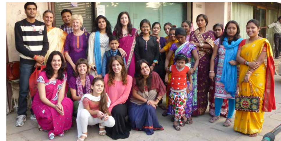
EQUIPO EN INDIA

Este equipo trabaja coordinadamente con los encargados de comunicación de cada uno de los grupos de voluntariado, lo que ha repercutido también en una importante mejora en la colaboración y la comunicación interna.