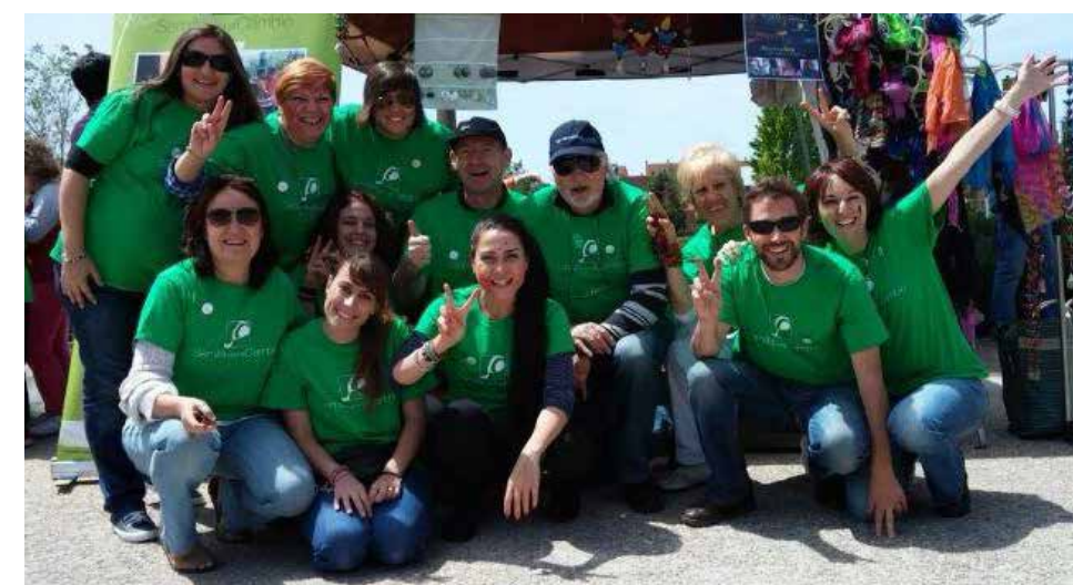
EQUIPO EN ESPAÑA